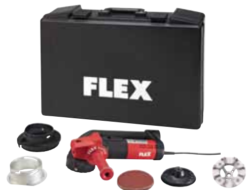
Beispiel: RE 14-5 115, Kit Schleifkopf Beton-Jet