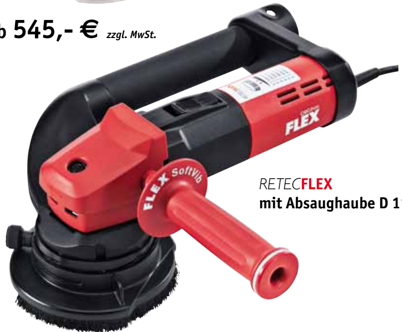
RETECFLEX mit Absaughaube D 115