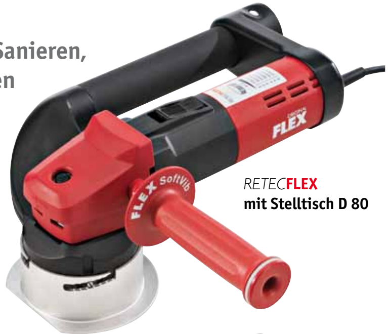
RETECFLEX mit Stelltisch D 80